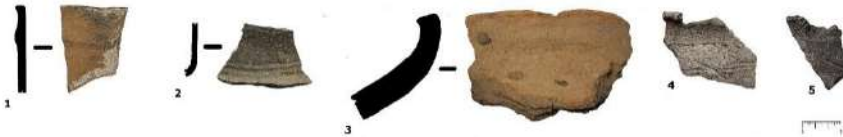
Рис. 1. Фрагменти керамічного посуду

Серед посудин на поселенні переважають горщики – 48% (усього керамічного комплексу) (рис. 2, 6-7, 10-12), банки – 12% (рис. 1, 1; 2, 1-5) та пательні-жаровні – 8% (рис. 2, 15-20). Значну групу складають різноманітні келихи, серед них присутні й циліндрошиїні (рис. 1, 2; 2, 9, 13-14). Зафіксовано також декілька фрагментів корчаг з добре заглаженою поверхнею та орнаментациєю прокресленими лініями і пружками (рис. 2, 8). На Октябрях знайдено фрагмент піфосоподібної посудини, які характерні для пізньосабатинівського часу (рис. 1, 3). Частка лощеної кераміки на поселенні становить лише 4%. Різноманітний пружок складає 60% поміж усіх типів орнаменту та розміщений на 30% усіх посудин з Октябрів (рис. 1, 1; 2, 3, 4, 5). Дрібнозубчастий штамп прикрашав 13% орнаментованих посудин або 4% усієї кераміки, а прокреслені лінії – 15% та 5% відповідно (рис. 1, 4, 5). Кількома екземплярами представлена пластична орнаментация (ручки-упори, «шишечки» тощо). Лише одна посудина прикрашена канелюрами (рис. 1, 2) [3]. Зафіксовано й специфічні поєднання різних орнаментарних стилів: під вінцем у ряд йдуть невеликі вдавлення кругоподібної форми, під ними, розміщена широка (наближена до канелюр), необережно прокреслена горизонтальна лінія по якій нанесено діагональні лінії (рис. 1, 4); штампи у вигляді кіл та прокреслені лінії різної ширини та орієнтації (рис. 1, 5).